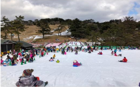
กิจกรรมลานหิมะ