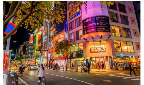
ช้อปปิ้งย่านเทนจิ