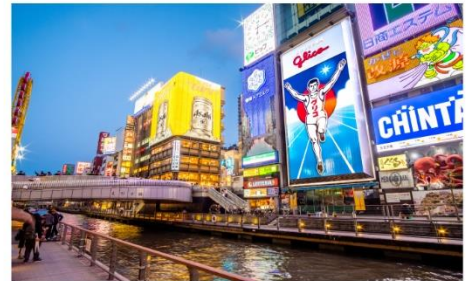
ย่านชินไซบาชิ โตงโมริ