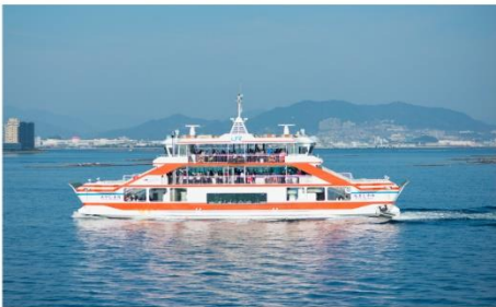
ล่องเรือสู่เกาะมียาจิมะ