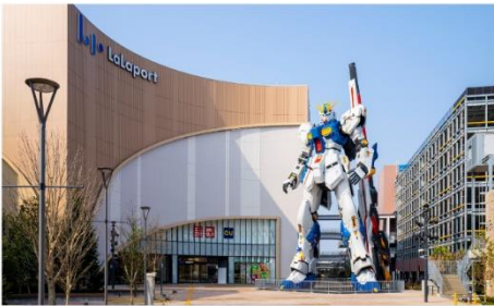
กันดั้มไอโตะ: ห้างลาลาพอร์ต