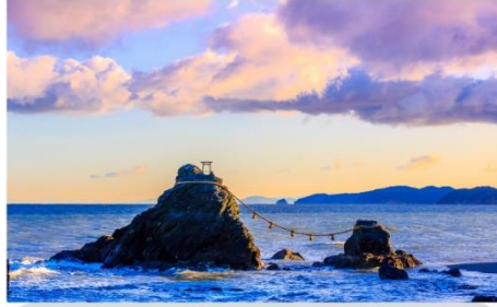
ชายหาดอิโตะชิมะ หินคู่รัก