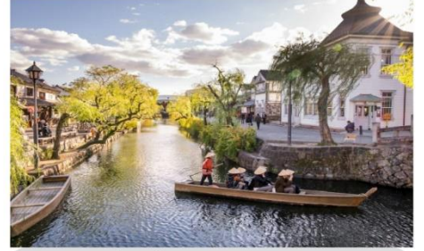
เขตอนุรักษ์คุระซึกิ