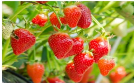
ฟาร์มสตอว์เบอร์รี่